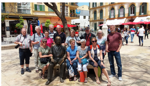
Kunstforeningen inkl. Picasso på Plaza Merced i Málaga

galleri NBs kunstforening var i foråret på besøg i mit spanske atelier ved Málaga. De 12 deltagere besøgte mig også senere i atelieret i Silkeborg. Det er hyggeligt og givende med disse besøg - og en dejlig måde at møde mennesker med et åbent kunstsyn med interesse for både min - og andres kunst.