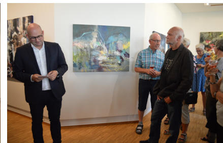
galleri NB. Justitsminister Søren Pape Poulsen åbnede min udstilling "Wild - North / West"