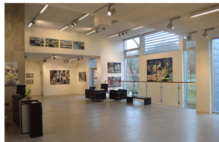
Belle Art Gallery

Min inspiration fra sidste års rejse til Island og Canada fornægtede sig ikke, og blev til to velbesøgte soloudstillinger i Belle Art Gallery & galleri NB . Der blev taget godt imod de nye, ekspressive værker fra både storby og natur. Gallerierne har stadig et par af "mesterværkerne" tilbage.