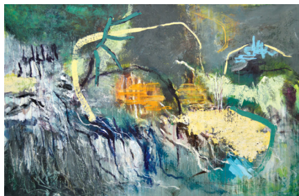
"Icelandic Waterfall" II, 95 x 150 cm. 2018. Akryl på lærred. Hos galleri NB