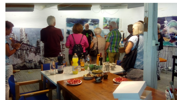
Besøg i Silkeborg